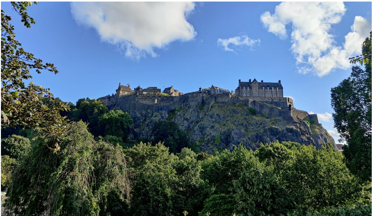
Blick auf die Edinburgh Castle

Das Semester an der University of Edinburgh hat mir ausgesprochen gut gefallen und kann ich nur jedem wärmstens empfehlen. Das Semester ist recht kurz und nimmt schnell Fahrt auf, sodass sich frühzeitige Wochenend-Trips in den Highlands sehr lohnen, bevor es zu kalt und stressig wird. Durch die Erasmus Finanzierung hat man zwar eine gewisse finanzielle Unterstützung, man braucht aber definitiv weitere Rücklagen, um die sehr hohen Lebenskosten vor Ort zu decken. Es lohnt sich definitiv auch frühzeitig zu den unterschiedlichen Societies zu gehen, um so in bunte Freundeskreise hineinzukommen. Wir hatten dieses Semester großes Glück, dass wir so viele Austauschstudierende in den Kursen waren, das hat ungemein zu einer tollen Studiums-Atmosphäre und vielen neuen Freundschaften geführt. Edinburgh ist eine großartige Stadt und ich hoffe, dass die University of Edinburgh auch in Zukunft noch ein langfristiger Austauschpartner für das Erasmus Programm bleibt.