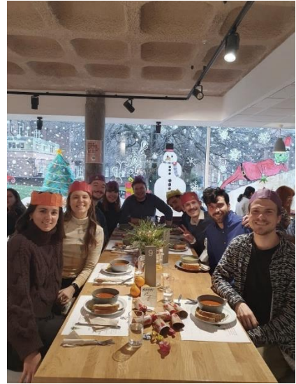
Highlights aus dem Uni-Alltag: Geburtstagsfeiern, Highland Exkursion und Christmas Dinner (Zierz, 2023)