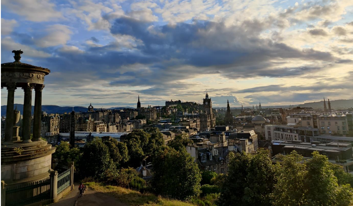
Aussicht vom Calton Hill (Zierz, 2023)