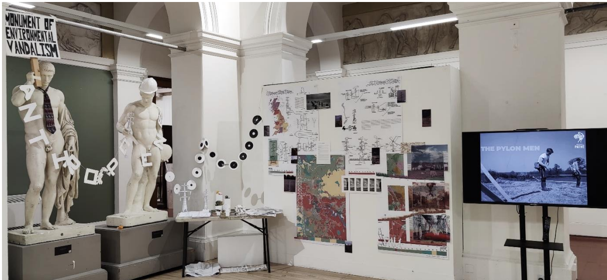
Eigene Abschlusspräsentation mit Videoinstallation (Zierz, 2023)